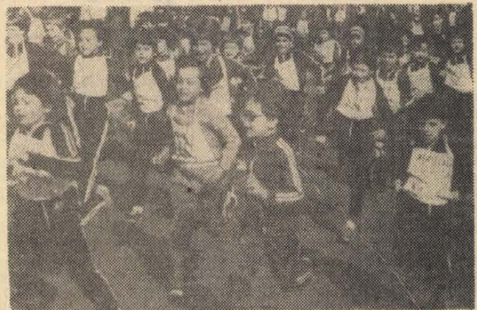
Különösen a kicsik jóvoltából igazi tömegverseny volt

Az egyes korosztályok győztesei: 2. osztály: Lányok: Szivasi háztömb körüli futóversenyt, a város diákjainak. A remek idő és a kijelölt új