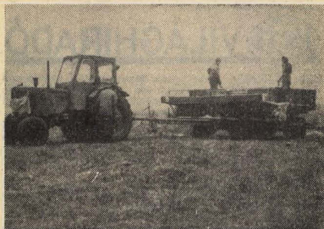
Dadon az Aranykalász tsz egyik brigádja a volt legelő termőföldök alakításán dolgozik