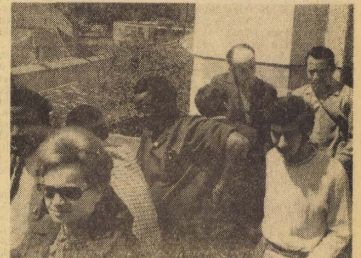
A Várhegyen folyó műemlékvédelmi munkálatokról nagy elismeréssel nyilatkoztak a delegátusok.