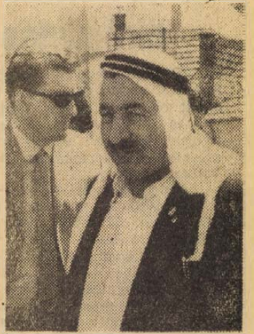
Egy portré a sokaságból: az iraki küldött

A vendégek Esztergomban ebédeltek, majd a késő délutáni órákban utaztak vissza Budapestre.